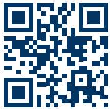
Nähere Infos unter gvh.de

Telefon: 0511 590-9000 Mo.–Fr. 06:00–23:00 Uhr, Sa. 06:00–20:00 Uhr, So. 07:00–20:00 Uhr